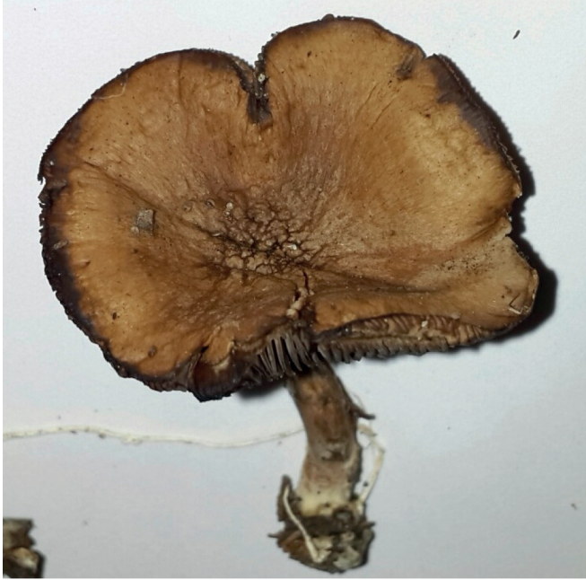
Şekil 1. Hasta yakınlarından temin edilen mantar örneği

HPLC analizinde alfa-amanitin ve beta-amanitine rastlanmadı. Yapılan incelemede mantar, muskarinden zengin olduğu bilinen Inocybe lacera spp. olarak türlendirildi (Şekil 1 ve 2). Inocybe lacera genellikle yaz ve sonbahar aylarında, daha nadir olarak kış başlangıcında gelişim gösteren ve ülkemizde yaygın bulunan bir mantar türüdür (Şekil 3). Kumlu, asidik veya besin bakımından fakir topraklarda, konifer ve yaprak döken ağaçların altında yetişir (17,18).