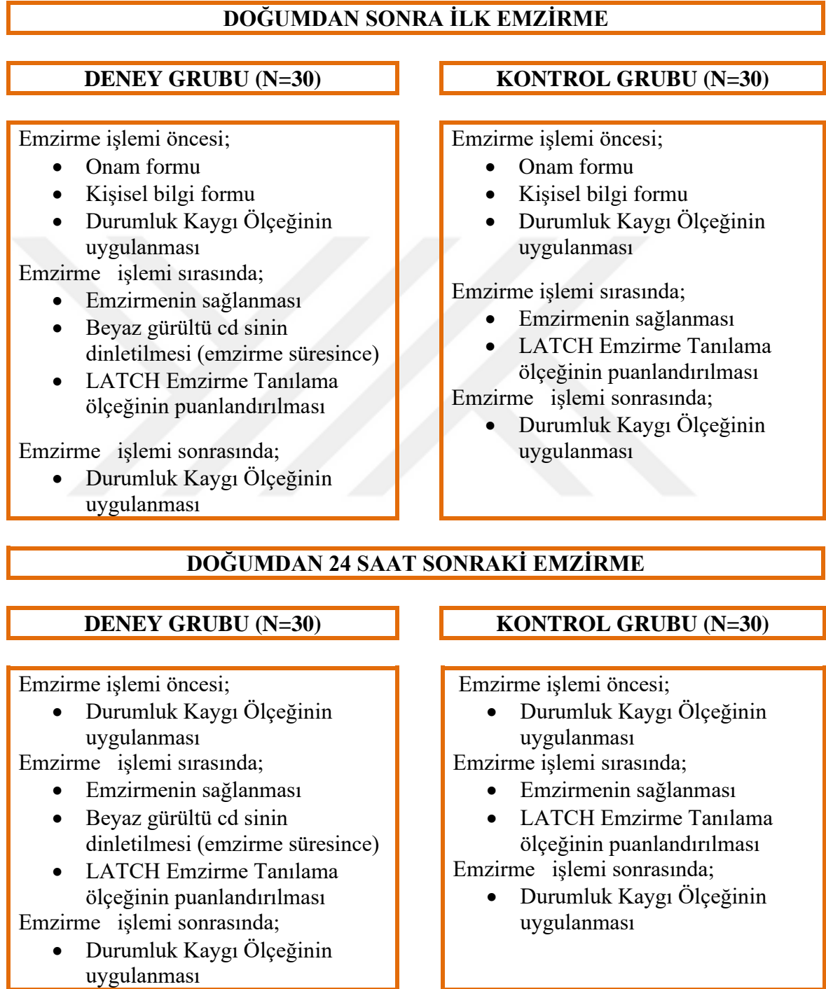
Şekil 3.1. Araştırma akış şeması

sonlanana kadar beklenmiş ve emzirme sonlandıktan sonra anne ‘‘Durumluk Kaygı Ölçeđi’’ni puanlandırmıştır. Müzik dinletme ve ölçeklerin uygulanması 60 ile 90 dk arasında sürmüştür.