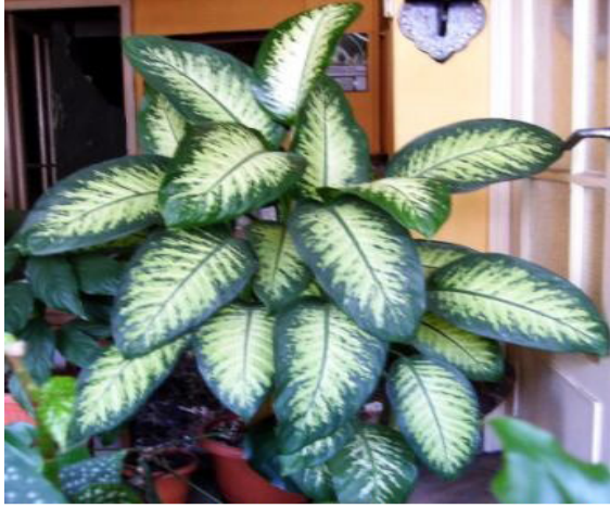
Resim 1. Dieffenbachia süs bitkisi