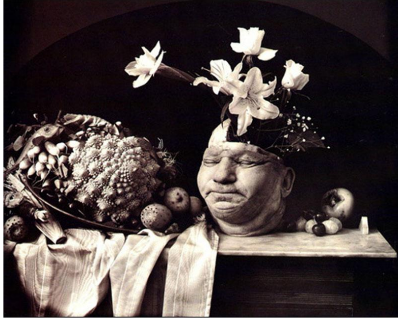
Görsel 5. Joel Peter- Witkin ( 1939), Still Life/ Marseilles , 1992, Fotoğraf, Fraenkel Galeri.

Sanatçının, fiziki güzellik hakkındaki ön yargıları sorgulayan ve gerçeküstü çizgiler taşıyan Kiss/Öpücük (1982) adlı fotoğrafı kendisini öpen kesik iki erkek kafasından oluşur. Üniversitenin tıbbi araştırmalar bölümünden bir günlüğüne ödünç aldığı erkek kafası, boyun kısmından kesilmiş ve tüm tendon, doku, kas yapısı ile karşımızda durmaktadır. İzleyici, ilk olarak yaşlı bir erkeğin kendisini öpmesinin düşüncesini sorgularken, bakış; aşağı doğru indikçe daha da tekinsiz bir manzara ile karşılaşarak, her ayrıntısını görebildiği kesik iki grotesk boyunla yüz yüze gelir. “Grotesk imgenin sanatsal mantığı olan, bedenin kapalı, pürüzsüz ve nüfus edilmez yönünün yok sayılışı ve bedenin yalnızca dış değil, iç parçalarının da sergilenişi” ( Rızvanoğlu, 2016, s. 31) fotoğrafa yansır. Her bir fotoğraf karesinin karanlık odada negatiflerinin çizimi ile oluşan görüntüler, fotoğraftan uzaklaşıp, boya tadı kazanır. Fotoğrafa ilham olan olayı Witkin şu cümlelerle açıklar: