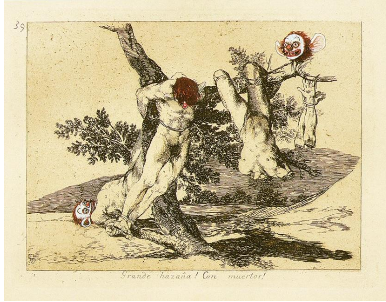
Görsel 3. Dinos ve Jake Chapman, Insult The Injury , 2003, Goya'nın baskı resim serisinin suluboya ile yeniden üretimi, eser yeri: John McEnroe Galerisi. ( https://www.worldartfoundations.com/arter-jake-dinos-chapman-in-the-realm-of-the-senseless/ )