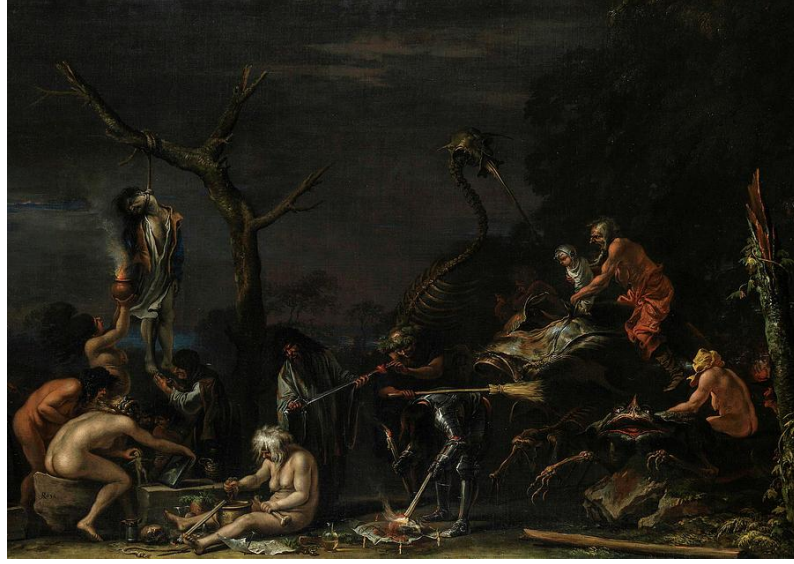
Görsel 1. Salvator Rosa (1615-1673), Witches at their Incantations, 1646 dolayları, tuval üzerine yağlıboya. Eser yeri: Londra Ulusal Müzesi.