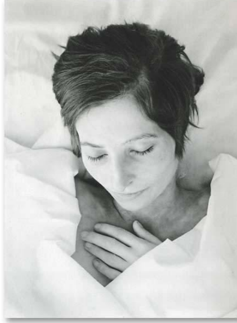
Görsel 6. Rudolf Schafer ( 1952), Sonsuz Uyku Serisinden, 1998, Fotoğraf. ( https://tarthead.com/2012/04/06/deaths-face-rudolf-schafer-images-may-upsetoffend/ )

Sanatçıların bu fotoğraflara yaklaşımları ölümün bir son ve uyarıcı özelliğini ortaya koyan temsil yerine, şu an yanımızda uyuyan bir süre sonra uyanacak bir kişinin tanıdıklığı ve aşinalığıdır. Bu yaklaşım, yakınları tarafından saklanmak üzere, kaybedilene ait bir resmin, ölünün tabutuna resmedildiği Fayyum Portrelerine götürür. Bu bağlamda John Troyer, 19. yüzyıl muhafaza teknolojilerinin, insan bedenine yüklediği yeni alımlama boyutunu tartışmaya sunar. “Bu muhafaza biçimi ölü bedeninin canlıymış gibi sunulmasına ve ölü beden imgesinde semantik bir kaymaya sebep olmuştur. 19. yüzyıl Viktoryen döneminde cenaze işlerini yürütenleri ölüm sonrası fotoğrafçıların imgelerindeki estetiği kopyalamaya başlarlar. Bu tür derin uykudaymış gibi tasvir edilen ölümler nedeni ile garip bir tür “canlı ölü” insan bedeni ortaya çıkmaktadır” (Troyer, 200, s. 25). Ceset imgesi, bir gün öleceğini bilen her canlı için rahatsız edici bir durumdur. Sürekli bir dönüşüm halinde olan, kontolden çıkmış bir beden yerine bu fotoğraflarda aşına olunanı saklı tutmaya çalışan bir yön bulunmaktadır. Bu çaba ya da niyet ise ölü beden imgesini son hali ile imge boyutunda kalmasını sağlamaktadır. Bedenin çürümesini durdurarak, ileride var olmayanı, son hali ile zamansız olarak sunmak, kendi içerisinde çelişkiler de taşır. Böylece bedenin grotesk yapısı belki de göz ardı edilmeye çalışılır.