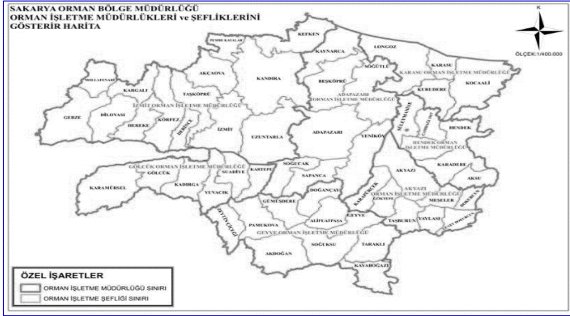
Şekil 1. Araştırma Alanı 1 (Sakarya Orman Bölge Müdürlüğü) (SOBM, 2019).