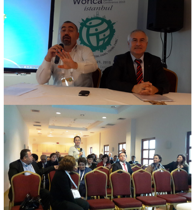
Resim 1 ve 2. “Workshop: Family Medicine Residency Training in Primary Care Settings: Family Health Centers for Teaching” 20. WONCA, İstanbul, 24 Ekim 2015,