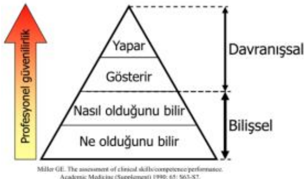
Şekil 2. Miller'in ustalık piramidi

Becerilerin ve klinik yeterliğin değerlendirilmesinde, her bir bileşenin doğru olarak ölçülmesini sağlayacak tek bir metottan bahsedebilmek neredeyse imkânsızdır. Miller'in piramidi (8), geçerliliğin değerlendirilmesindeki çerçeveyi belirlemesi anlamında bize yol gösterici olabilir (Şekil 2).