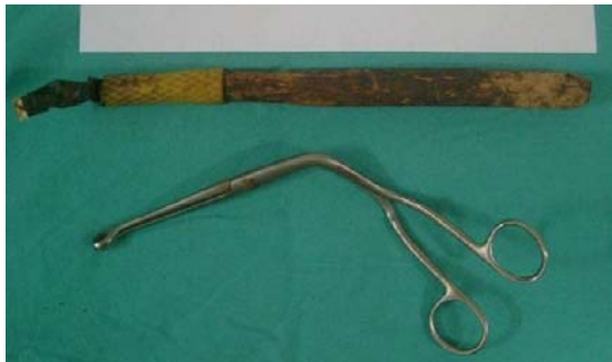
Şekil 2. Çıkarılan yabancı cisim ve cismin çıkarılması için kullanılan Megyll pensi