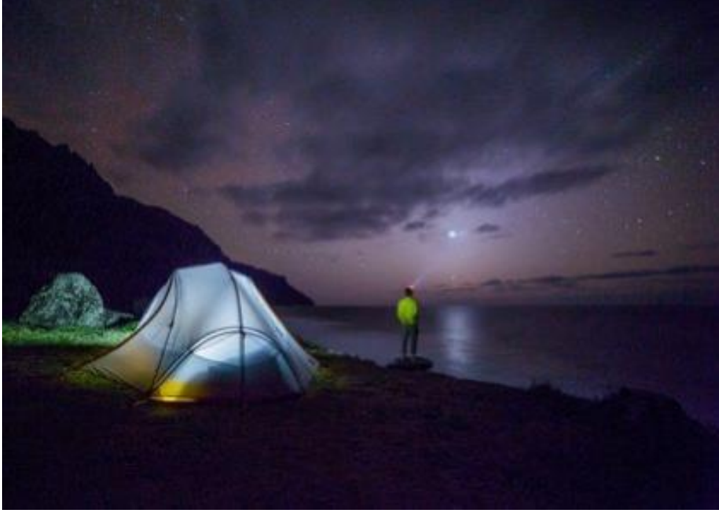
(Anonim 2020 a)