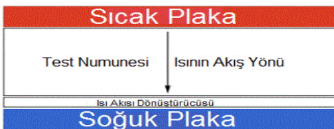
Şekil 2: Hot plate metodu ile ölçüm.

He (2005) ısı iletim katsayısını hızlı bir şekilde ölçmek için sıcak disk metodunu geliştirmiştir. Sıcak disk tekniğinde geçici bir düzlem kaynak kullanılarak iletim katsayısı ölçülmektedir. Bu metodun avantajları; geniş ölçüm aralığı