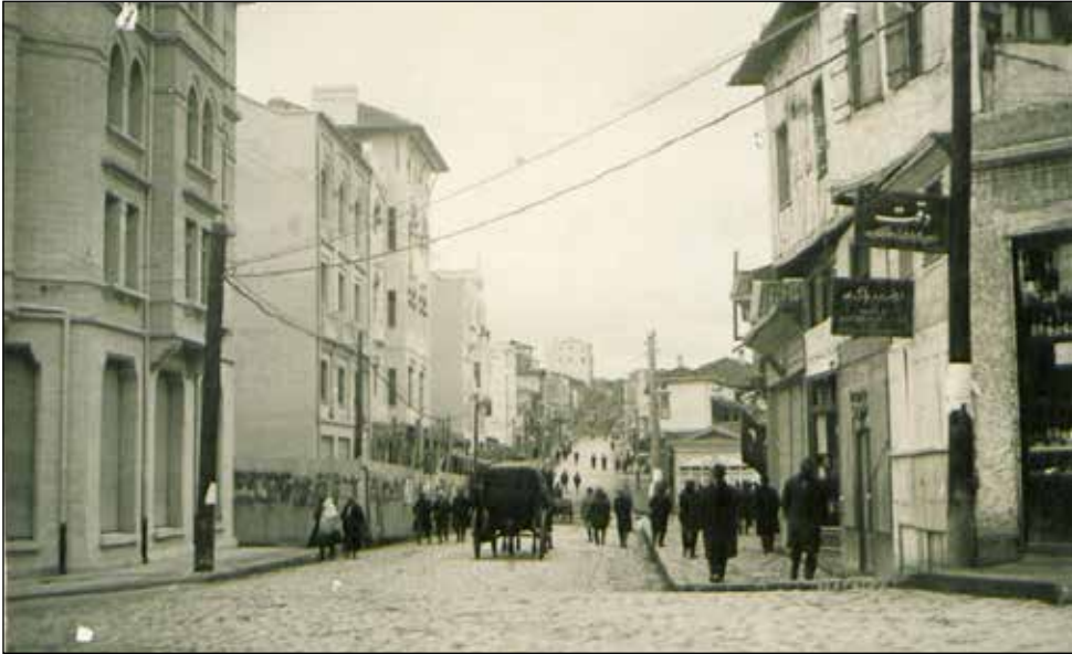
Şekil 4. Anafartalar Caddesi, 1926-1927.