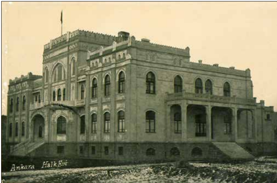
Şekil 8. Ankara Halkevi, 1930.

Talu kimi yazılarında, sıklıkla ele alıp değerlendirilen konulara -Ankara'daki konut sorunu gibi- temas etmekle birlikte yazılarının büyük çoğunluğunda özgün bir tavra