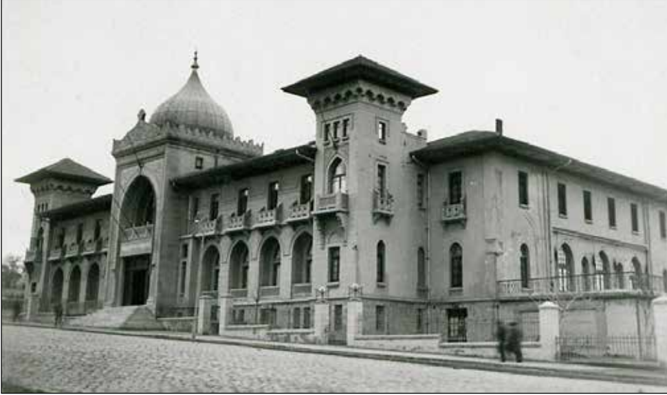
Şekil 6. Ankara Palas, 1933-1935.

Kaynak: Koç Üniversitesi VEKAM Kütüphanesi ve Arşivi, Envanter No: 2035.