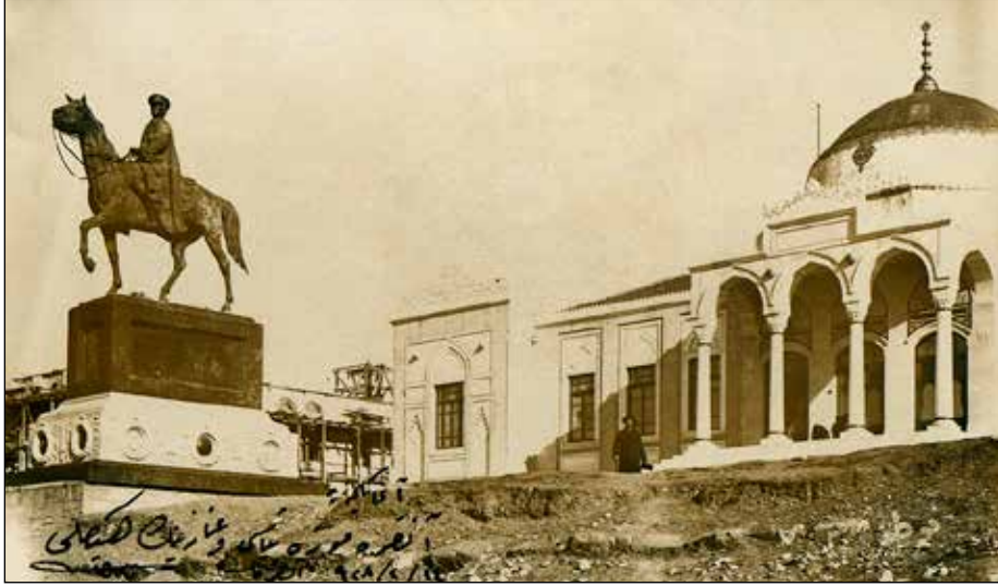
Şekil 2. Ercüment Ekrem'in şiirinde geçen Pietro Canonica'nın yaptığı heykel, 1928.