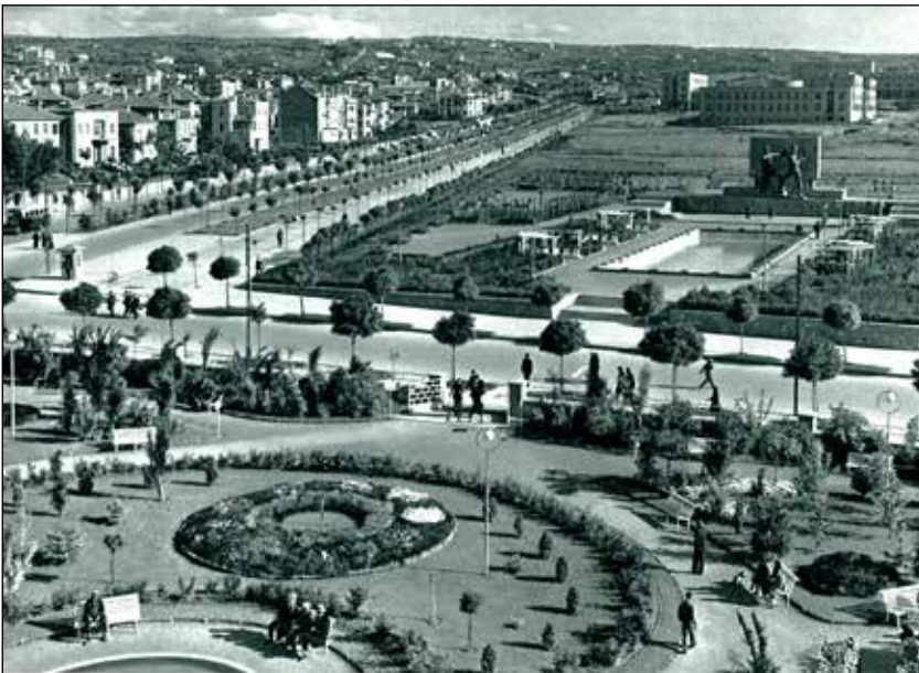
Şekil 3. Ercüment Ekrem'in “emniyet ve güven duygusu” oluşturduğunu düşündüğü yeni Ankara, 1930 (Fotografda Kızılay Parkı, Güven Park, Atatürk Bulvarı ve Bakanlıklar görülmektedir).

Ercüment Ekrem'in hemen her yazısında -o dönemin birçok yazarı gibi- ideolojik farklılığı belirginleştirecek biçimde İstanbul Ankara karşılaştırmasına gitmesi, Ankara'yı birçok bakımdan üstün gösterme çabası dikkat çekicidir. Söz gelişi Ercüment Ekrem, Yenişehir'de geniş bir modern bir mahalle teşkil eden Bakanlıkların (Şekil 3), oralara işi düşüp de gidenlerin üzerinde, bir emniyet ve güven duygusu oluşturduğunu, bu temiz güzel ve muntazam binaların içinde dağınıklık çirkinlik ve çapraşıklığın olamayacağı hissini verdiğini iddia eder. Ona göre Osmanlı'nın meham-ı umur (önemli işler) değir-