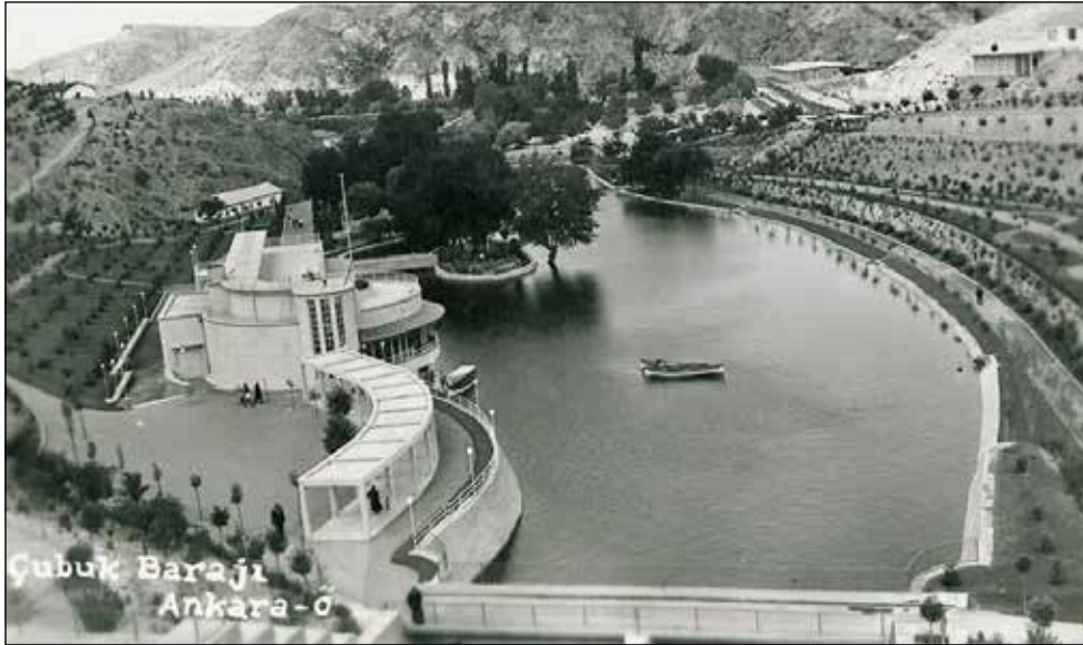
Şekil 7. Çubuk Barajı'nın 1940 yılına ait bir fotoğrafı (Fotoğrafta Ercüment Ekrem'in "yapılması planlanıyor" dediği Baraj Gazinosu da görülüyor).

Böyle spor sahalarının behemehâl şehrin dışında bulunmasını isteyen zihniyet sahipleri bir pazar günü Ankara'da İstasyon Caddesi'nde kolaçan etmek zahmetini ihtiyar etseler, yarış seyretmek için, halkın ta Veliefendi'ye, maç görmek için de Edirnekapısı'ndaki Çukurbostan'a kadar gidemeyeceğini mutlaka takdir ve teslim ederlerdi (Talu, 1937j, s. 5).