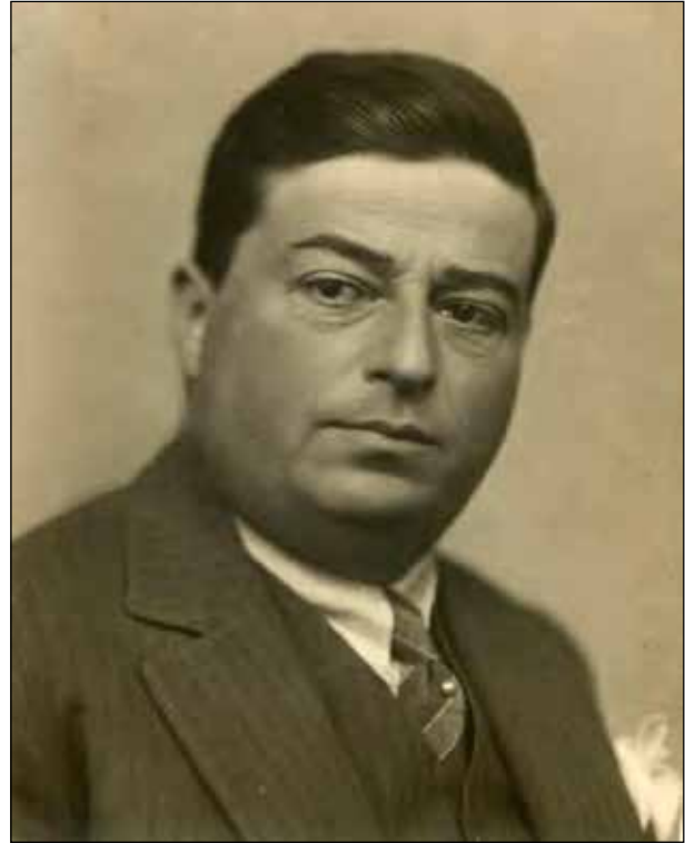
Şekil 1. Ercüment Ekrem Talu.

değişikliklerinden dolayı kendi tabiri ile Ankara İstanbul arasında mekik dokumaktadır. Ercüment Ekrem, Ankara'da bulunduğu zaman Siyasal Bilgiler Okulunda, Gazi Eğitim Enstitüsünde, Ankara Hukuk Fakültesinde, Polis Kolejinde, Gazi Terbiyede dersler vermiştir. Ayrıca Halkevlerinin gezgin konferansçısı olarak Erzurum, Zonguldak, Konya, Mersin gibi illerde konuşmalar yapmıştır. Talu, 1943'te eşi Hatice Hanım'dan ayrıldıktan sonra İstanbul'a döner (Karaca, 1993, ss. 33-34). Ercüment Ekrem'in biyografisini yazanlar bu tarihten sonra İstanbul'dan bir daha ayrılmadığını belirtiyorlar. Ankara'ya gelişleri varsa bile bunlar biyografisinde anılmayacak kadar sıradan ve kısa süreli seyahatler olmalıdır. Ercüment Ekrem'in Ankara'yla irtibatı konusunda verdiğimiz bu bilgiler, yazarın Ankara'da 1920 ile 1943 yılları arasında çeşitli görevler sebebiyle dört farklı zaman diliminde yaklaşık sekiz yıl ikamet ettiğini göstermektedir. Bahsi geçen yıllar, aynı zamanda Ankara'nın en kritik zamanlarıdır. Millî Mücadele, inkılaplar, yeni bir ulus inşası ve zihniyet dönüşümü gibi birçok mesele bu yılların gündemini teşkil etmektedir.