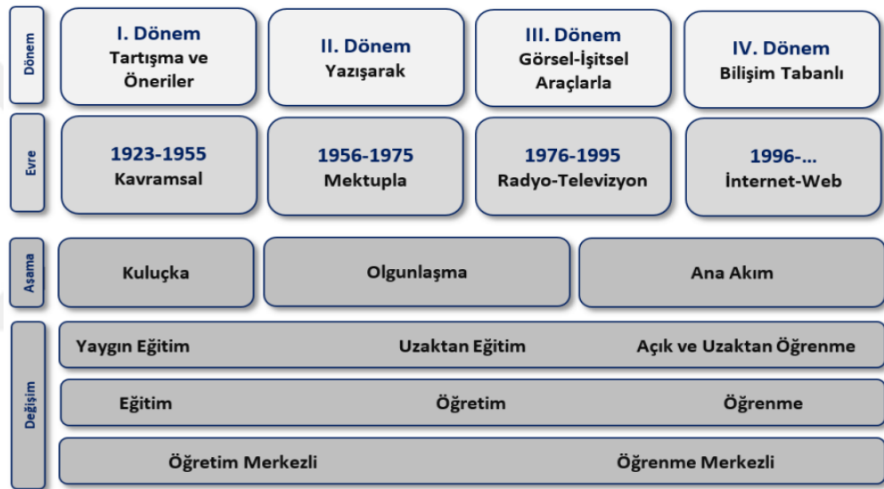
Şekil 2. Uzaktan Eğitimin Türkiyedeki Dönem ve Evreleri.

yine MEB'e bağlı Okul Radyosu ve TV Okulu uzaktan eğitim örneği olarak görülmektedir (Bozkurt, 2017). Anadolu Üniversitesinin Açık öğretim programları ile ortaöğretim seviyesinde eğitim veren Açık Lise programları ülkemizde uzaktan eğitim sistemine verilebilecek örnekler arasındadır. Genellikle mektup ile başlayan bu süreç, teknolojinin gelişmesi ve alt yapı sistemlerinin kurulmasıyla birlikte yerini radyo, televizyon ve sonrasında bilgisayar ve internet ortamına bırakmıştır. Şekil 2'de görüldüğü gibi Türkiye'de uzaktan eğitim 1996 yılı ve sonrasında bilişim tabanlı olarak gerçekleşmeye başlamıştır.